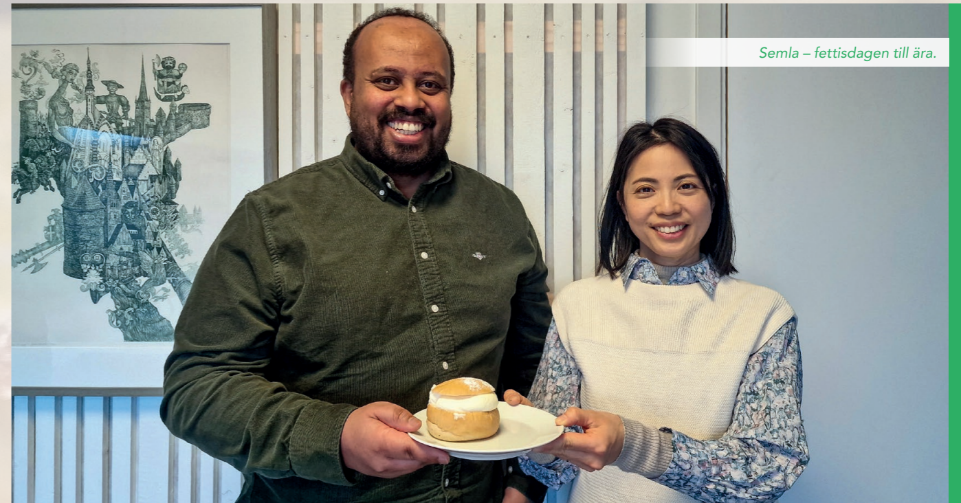
Semla – fettisdagen till ära.