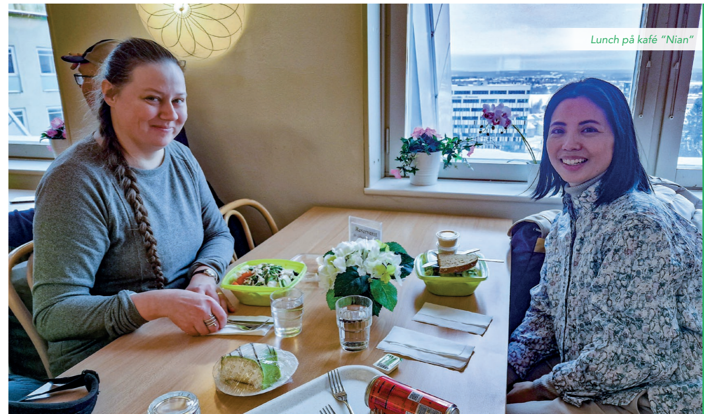
Lunch på kafé "Nian"

när man har en gästande forskare eller läkare från annat land.