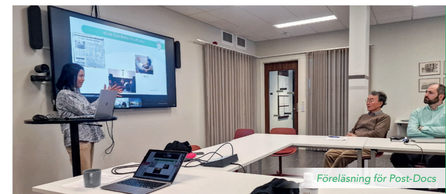
Föreläsning för Post-Docs