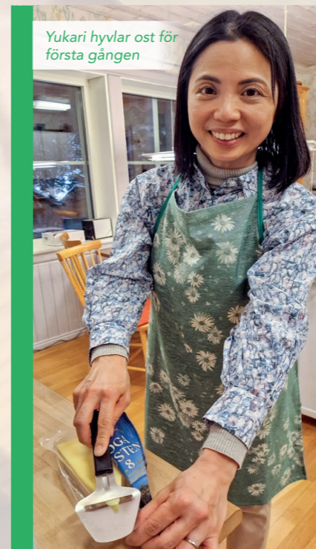
Yukari hyvlar ost för första gången